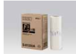
MASTER RISO TIPO FII (B4: 250 hojas)