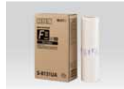
MASTER RISO TIPO FII (Tabloide: 215 hojas)