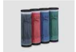
TINTA COLORIDA RISO TIPO FII (1000 ml)

A marca RISO i Quality indica um produto RISO compatível com o RISO i Quality system