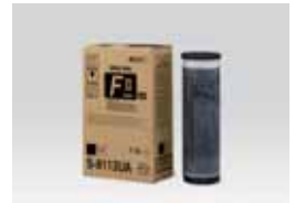
TINTA PRETA RISO TIPO FII (1000 ml)