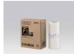
MASTER RISO TIPO FII (Legal: 250 folhas)