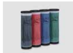
TINTA COLORIDA RISO TIPO FII (1000 ml)

A marca RISO i Quality indica um produto RISO compatível com o RISO i Quality system