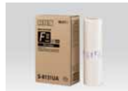
MASTER RISO TIPO FII (Ledger: 215 folhas)