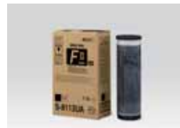
TINTA PRETA RISO TIPO FII (1000 ml)